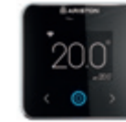
CUBE S NET

La sonda de ambiente "Cube S Net" garantiza el rápido y fácil acceso a la app Ariston Net. Siempre conectado con tu caldera.